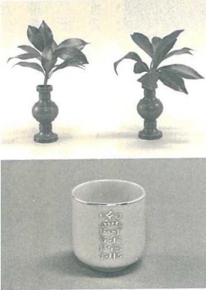
華瓶(上)と茶湯器(下)

具体的には、華瓶一对に水 を入れ、桜または青木を生 け（色花は用いない）、上卓 に置きます。桜を生けるの